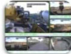
Civil Work Vehicle