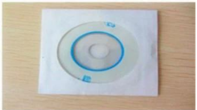
CD ( Manual & Software inside )