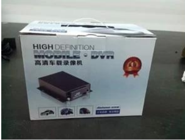
Richmor Brand Package