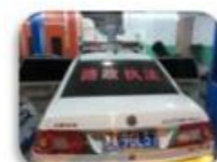
Road Police Car