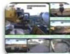
Civil Work Vehicle