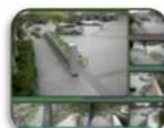
Fixed place monitor