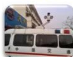
Traffic Inspection Car