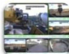
Civil Work Vehicle