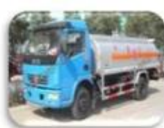
Dangerous chemical car