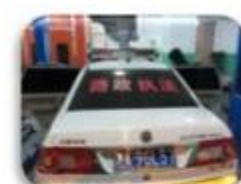
Road Police Car