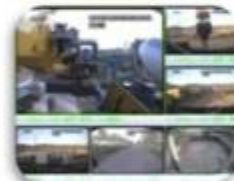
Civil Work Vehicle