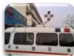
Traffic Inspection Car