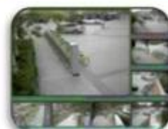
Fixed place monitor