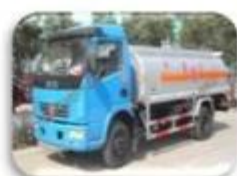
Dangerous chemical car