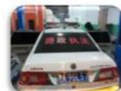
Road Police Car