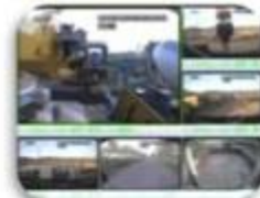
Civil Work Vehicle