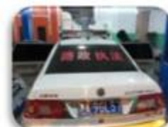
Road Police Car