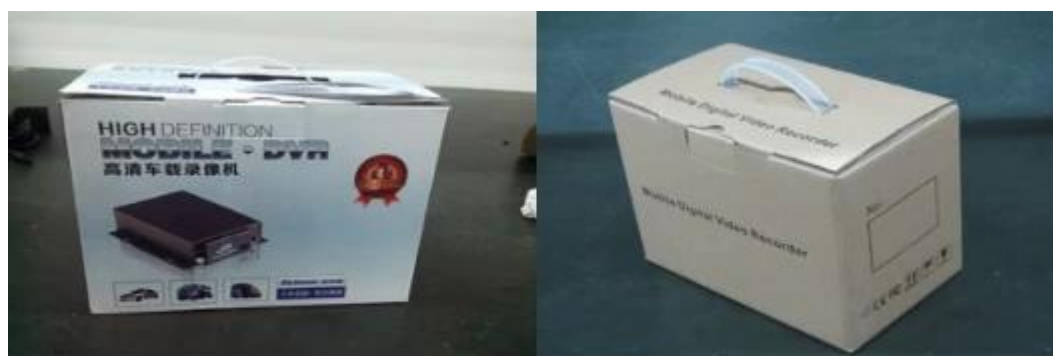
Richmor Brand Package