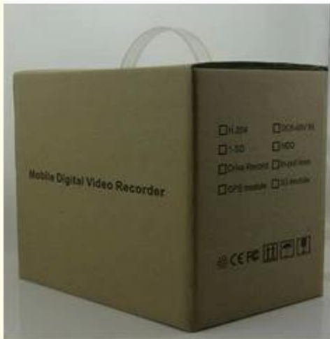
Brand Packing & Blister Packing