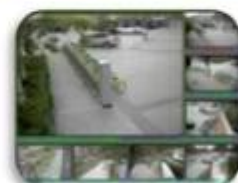
Fixed place monitor