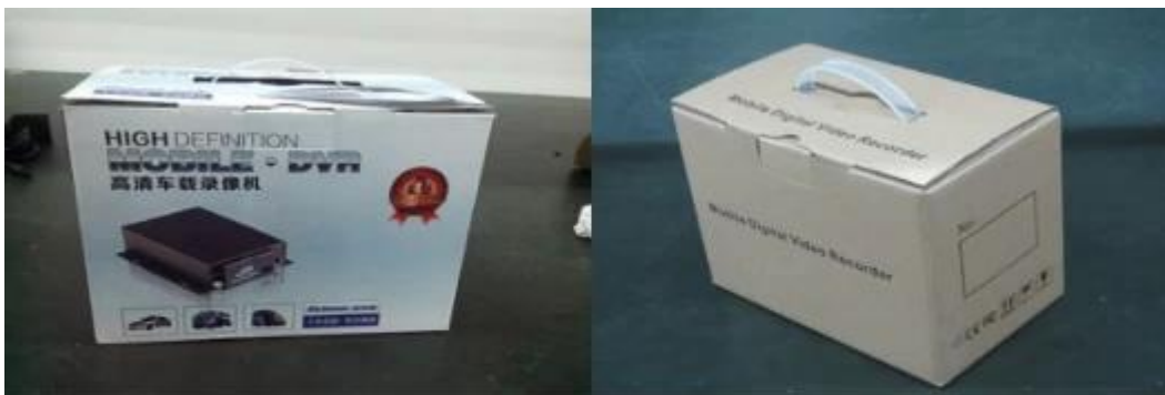
Richmor Brand Package