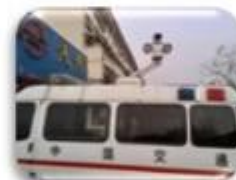
Traffic Inspection Car