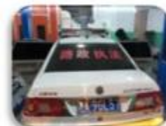
Road Police Car