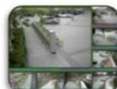
Fixed place monitor