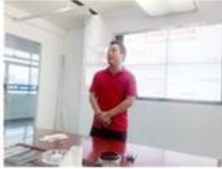
lecturer for Execution