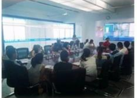
Technical Training For Fast Response to Customer Richmor 锐驰