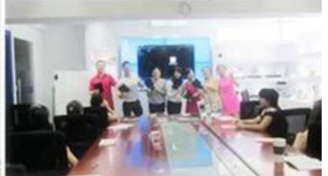
Inner Training after study from Alibaba in July