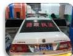
Road Police Car