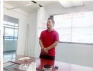
lecturer for Execution