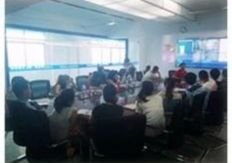
Technical Training For Fast Response to Customer Richmor 锐驰