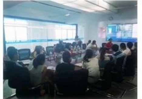
Technical Training For Fast Response to Customer Richmor 锐驰曼