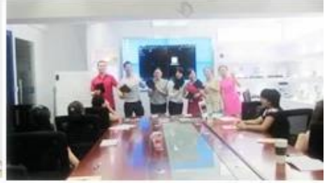
Inner Training after study from Alibaba in July