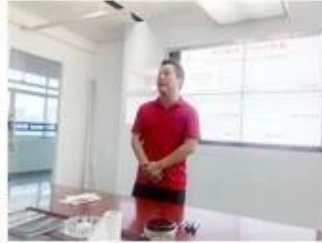
lecturer for Execution