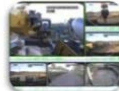
Civil Work Vehicle