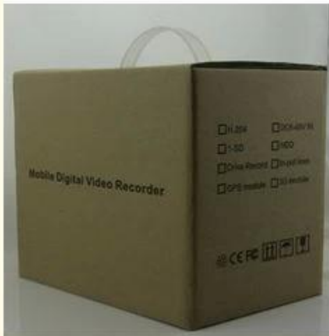
Brand Packing & Blister Packing