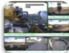
Civil Work Vehicle