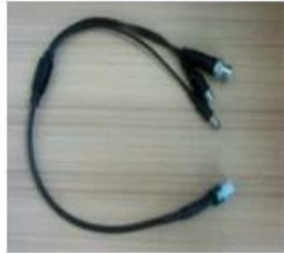
AV Input & Output Cables