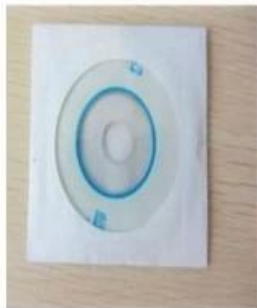
CD ( Manual & Software Inside)