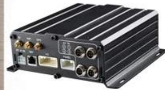
7000 HDD Mobile DVR