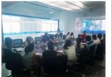
Technical Training For Fast Response to Customer Richmor 锐驰曼