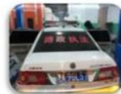
Road Police Car