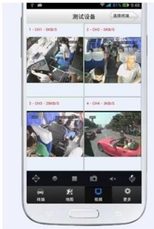
Naše mobilní DVR projekt pro vozidla