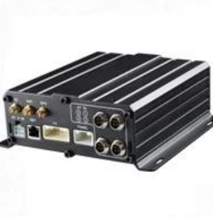
7000 HDD Mobile DVR