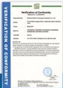
VERIFICATION OF CONFORMITY