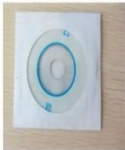
CD ( Manual & Software Inside)