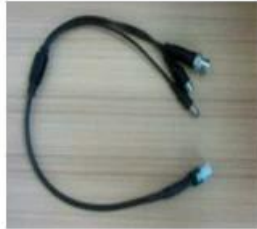
AV Input & Output Cables