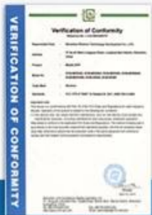
VERIFICATION OF CONFORMITY