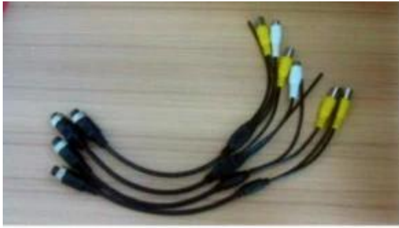
AV Input Cables