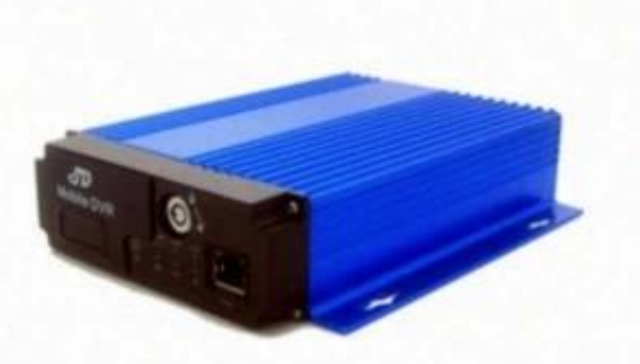
SD Mobile DVR