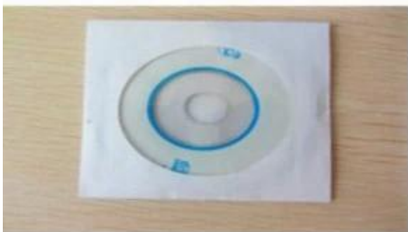
CD ( Manual & Software Inside)