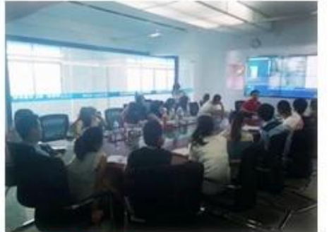
Technical Training For Fast Response to Customer Richmor 锐驰曼