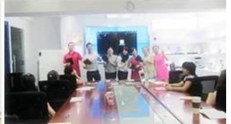
Inner Training after study from Alibaba in July