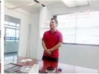
lecturer for Execution