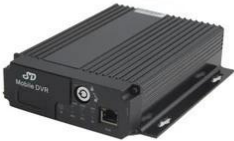
SD Mobile DVR with 3G GPS