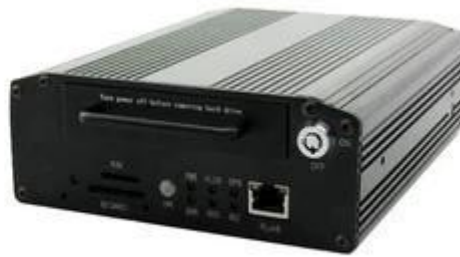
HD Mobile DVR with 3G GPS