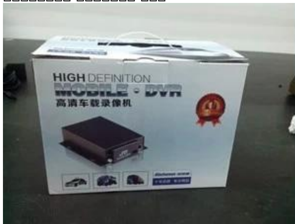
Richmor Brand Package