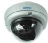
Car Camera Series