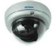
Car Camera Series

:لمزيد من المعلومات الرجاء عدم التردد في الاتصال بأيميلي