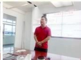
lecturer for Execution