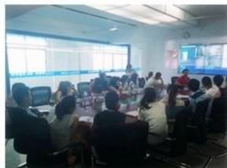
Technical Training For Fast Response to Customer Richmor 锐驰曼