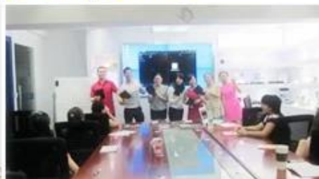
Inner Training after study from Alibaba in July