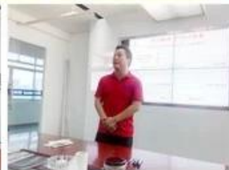
lecturer for Execution