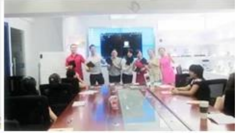
Inner Training after study from Alibaba in July