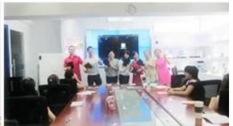
Inner Training after study from Alibaba in July